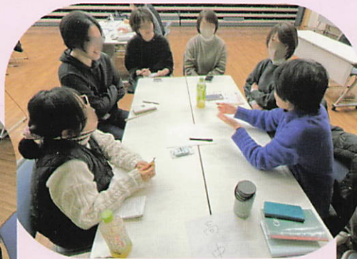
高中保護者で仲良くトーク