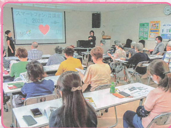
「山一スマホ講座」 多世代参加のスマホ講座でつながる♪