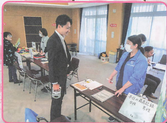
多世代交流ひろば「きしベース」 ここから広がるきしべのワクワク♪