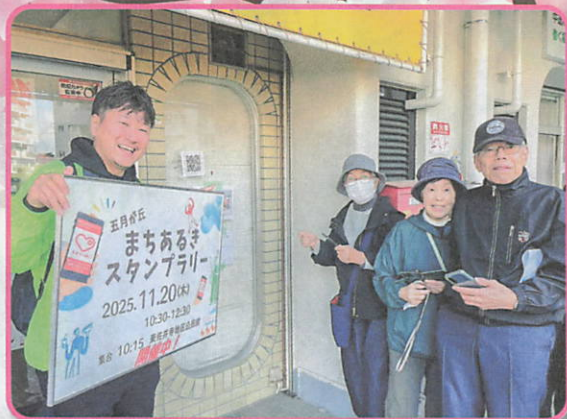
「五月が丘スタンプラリー」 みんなで地域を巡ろう・学ぼう♪