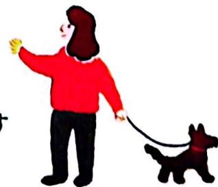
illustration / Tomoe MASUTANI