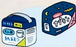
おむつ・生理用品など