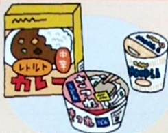
非常食やレトルト食品など（タンクなども便利）