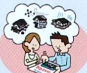
災害保険への加入