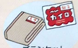
ブランケット ・カイロなど