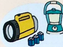
懐中電灯・ランタン