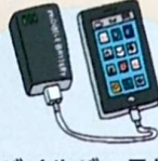
モバイルバッテリー