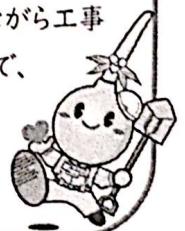
豊中岸部線の線形はイメージです

今後とも環境に留意しながら工事に取り組んでまいりますので、引き続きのご理解、ご協力をお願いいたします。