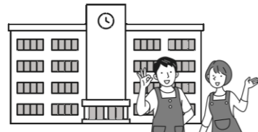
地域の行事情報・募集を発信