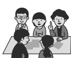
まちづくりネットワークなど による地域住民により企画