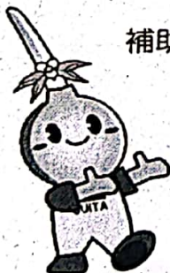
吹田市イメージキャラクターすいたん

〒564 8550 吹田市泉町1丁目3番40号 (吹田市役所 1階 105番窓口) 市民部 市民総務室 消費生活担当 TEL 06-6384-1354 FAX 06-6385-8300