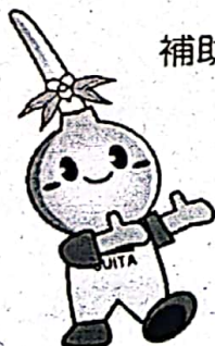
吹田イメージキャラクターすいたん

〒564 8550 吹田市泉町1丁目3番40号 (吹田市役所 1階 105番窓口) 市民部 市民総務室 消費生活担当 TEL 06-6384-1354 FAX 06-6385-8300