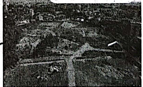
① 千里山西6丁目付近