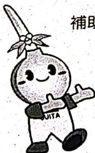
吹田イメージキャラクター「うじたん」

〒564 8550 吹田市泉町1丁目3番40号 (吹田市役所 1階 105番窓口) 市民部 市民総務室 消費生活担当 TEL 06-6384-1354 FAX 06-6385-8300