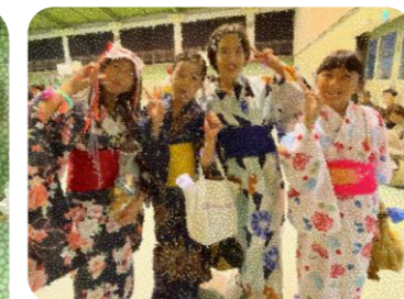
秋祭り妖怪盆踊り

お天気が危ぶまれたため、市民体育祭はグラウンドで、秋祭りは体育館での開催にし、無事に開催できました。会場提供などのご協力をいただいた佐竹台小学校、当日のお手伝い、準備や後片付けを担っていただいた皆さま、ご協力いただきありがとうございました。参加された方からは、楽しかったというお声をいただいたいておりますし、子どもたちにも良い思い出を作れたことと思います。今後とも大人も楽しめる行事を行いたいと思いますので、今後ともご協力をお願いいたします。