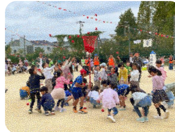
市民体育祭スポーツフェスタ