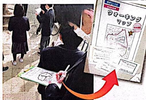
学びを振り返り、生徒自身ができることを考え、実行できるよう寄り添います

体験や講話でなく、生徒自身が自分たちのできることを考える場、通称「すいこれ」(すいたのこれからを考える)に取り組む学校もあります。生徒の発案で、高齢者のためのウォーキングマップの作成に取り組み、地区福祉委員会の協力を得て、高齢者へ配布した学校もありました。