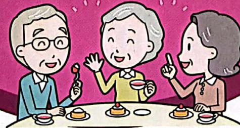
高齢者の居場所づくり (いきいきサロン)

おおむね小学校区に1つ組織され、吹田市内には33の地区福祉委員会が活動しています。それぞれの地域で暮らす住民が地域の特徴にあった方法で「住民同士の助け合い・支え合い」をボランティアで行っています。