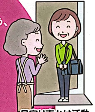
見守り声かけ活動