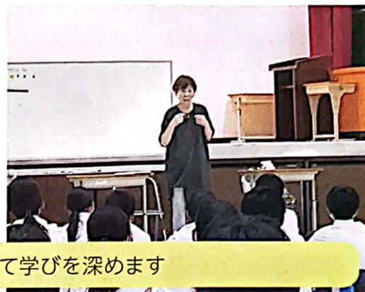
体験や講話を通じて学びを深めます