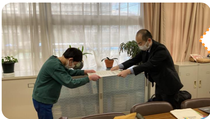
佐竹台小学校にて表彰状の授与が行われました。 おめでとうございます！