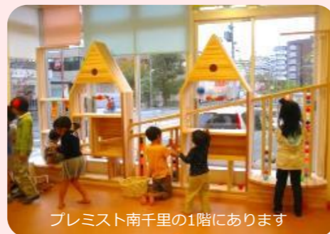
プレミス南千里の1階にあります

①おひさまルームは、空調・子どもお部屋でのびのび遊ぶことができます。 ②おひさまルームは、空調・子どもお部屋でのびのび遊ぶことができます。 ③おひさまルームは、空調・子どもお部屋でのびのび遊ぶことができます。