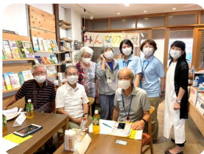
地域包括センターさん、自治会、ボランティアの皆さんとの地域福祉の打合せを経て「ひろばで体操」が実施となりました。