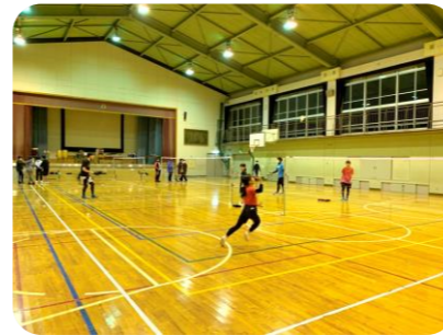
「バドミントンを楽しもう！」の様子