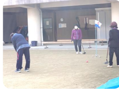
「グラウンドゴルフ体験会」の様子