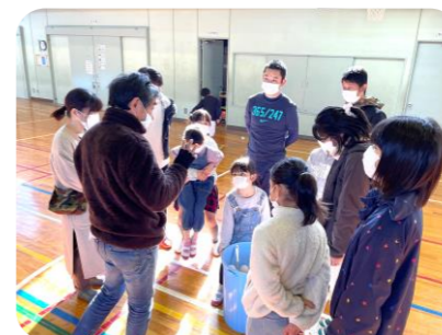
「たまたま運動会」は中止となりましたが、地域の有志の方の協力を得て、次年度に向けて、新しいたまたまの方法を検討していただきました。