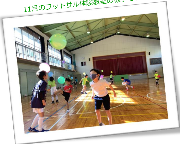
《 参加希望の方は、当日直接会場にお越し下さい 》