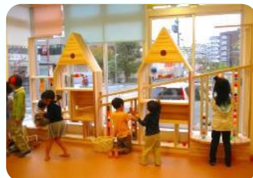
おもちゃのある楽しいお部屋です

※おひさまルームの開放日ボランティアを募集しています。お手伝いいただける方はこちらまでご連絡ください。 satakedai.s.p@gmail.com