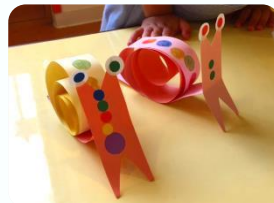
楽しい工作タイムも