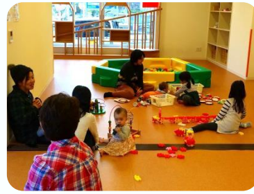
飲み物やおやつ持参OKです