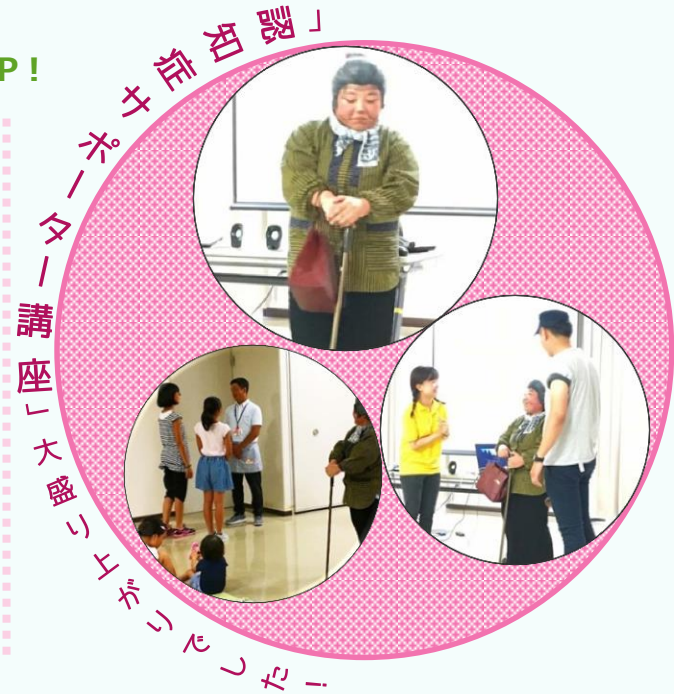
地域包括支援センターさん＆社協さんの寸劇が大盛り上がり！小学生も寸劇に参加し楽しく学びました。